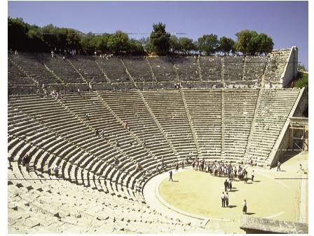
Το θέατρο της Επιδαύρου 350 π.Χ. Η Επίδαυρος βρίσκεται στην Πελοπόννησο.